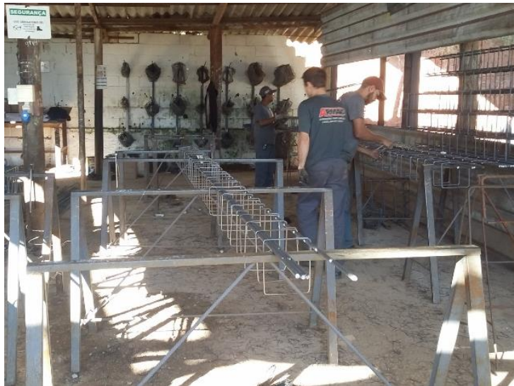
Figura 5: Funcionários operando sem EPI's