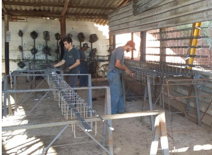
Figura 4: Funcionários operando sem EPI's