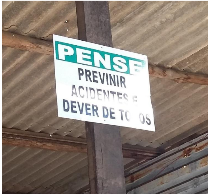
Figura 6: Placa instalada na area de produção