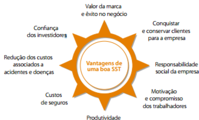
Figura 1: Vantagens do investimento na Segurança do Trabalho