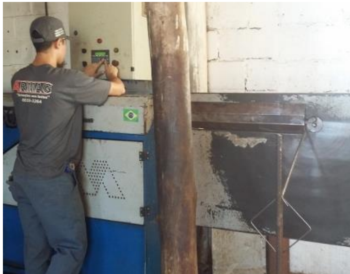
Figura 3: Funcionário sem EPI's

Durante visita na empresa realizada para a identificação do local, perigos e erros cometidos na rotina de trabalho cotidiano, foi possível perceber alguns erros rotineiros que serão citados como objeto de levantamento para a proposta e elaboração de um programa simples de procedimentos para a empresa.