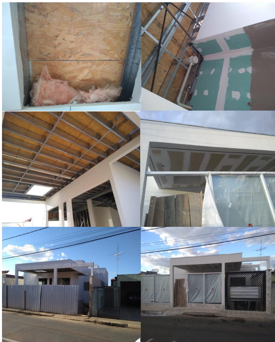
Imagem 2 – Fotografias, em fases distintas, da edificação em Light Steel Framing analisada