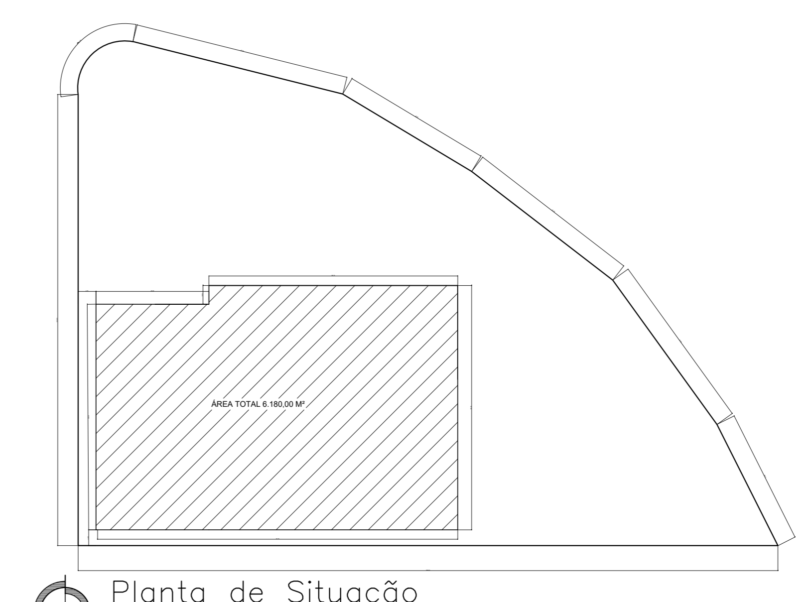
Planta de Situação ESC. 1/1000